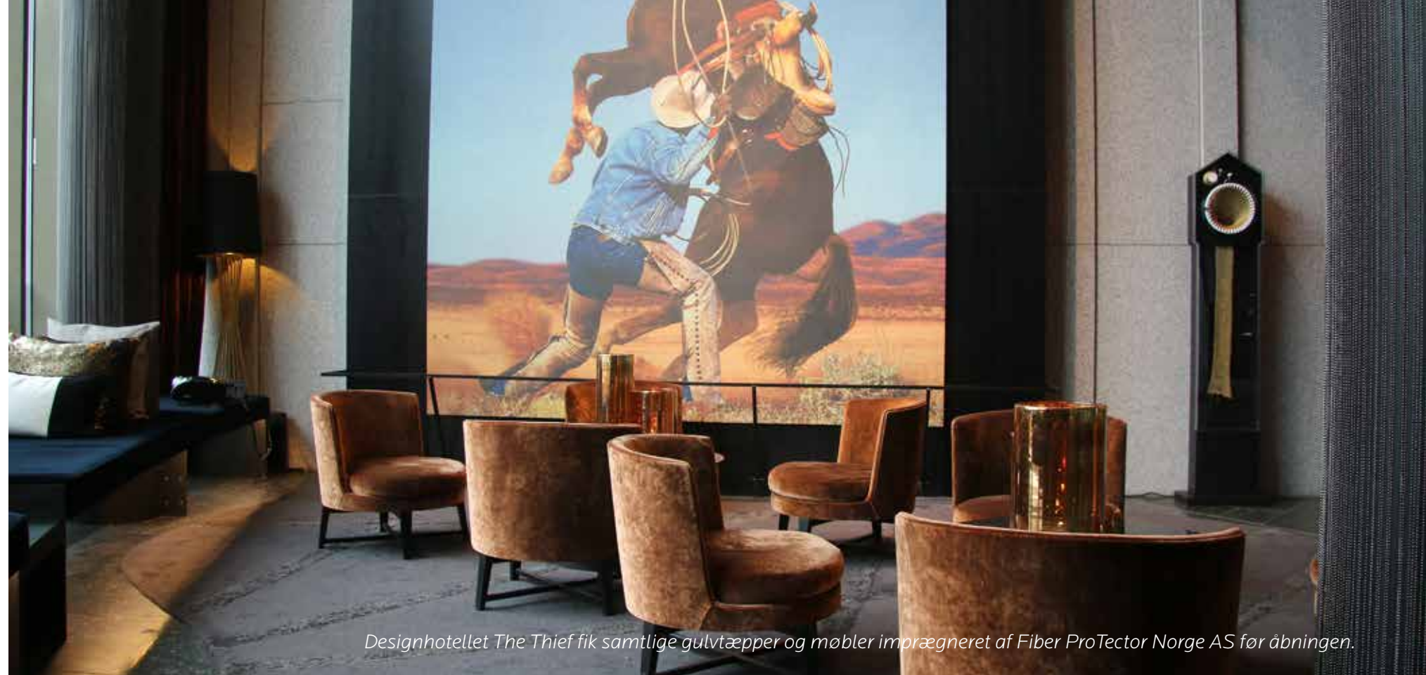
Designhotellet The Thief fik samtlige gulvtæpper og møbler imprægneret af Fiber ProTector Norge AS før åbningen.

FiberProtector danner en usynlig molekylær beskyttelse rundt om hver fiber. Dette bevirker en effektiv beskyttelse mod alle typer organisk væske, snavs, og støv, som ellers ville være trængt ind i fiberen og dannet permanente pletter. Behandlingen beskytter endvidere mod UV-stråling og fysisk slitage.