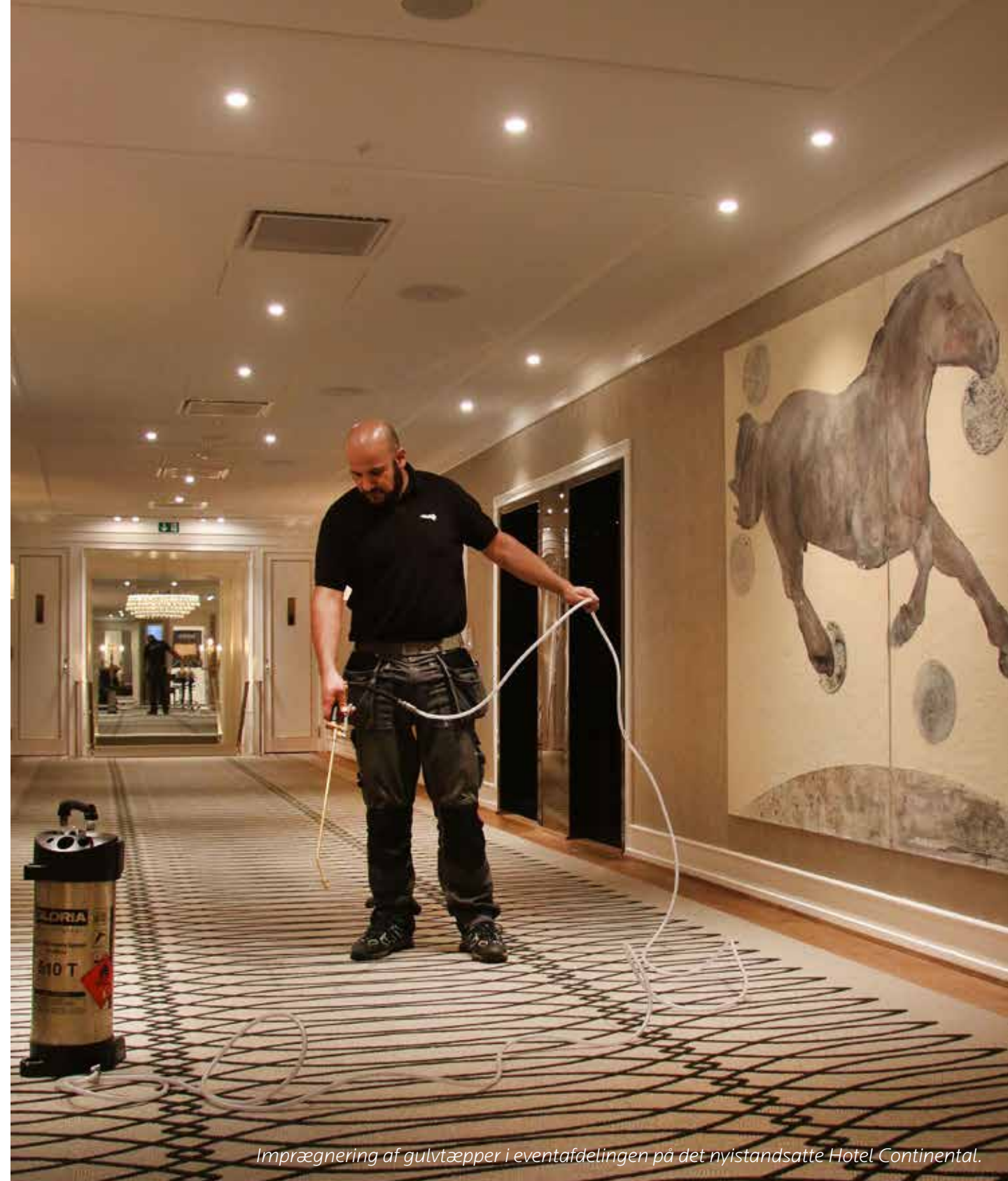
Imprægnering af gulvtæpper i eventafdelingen på det nyistandsatte Hotel Continental.

“Vi har siden efteråret 1999 benyttet servicen fra Fiber ProTector Norge AS i forbindelse med vedligehold af gulvtæpper og møbler i vore lounges for de rejsende i Gardermoen. Servicen består af rensning og imprægnering af gulvtæpper og møbler samt læderpleje. Vi er meget tilfredse med den professionelle udførelse, kvaliteten og opfølgningen leveret af Fiber ProTector. Det er vigtigt for os at vore passagerer oplever vore lounges som rene og velplejede.