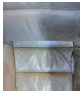
Foto: Fiber ProTector læderrestaurering.